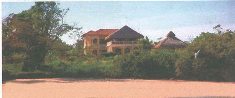
A villa sits above the sandy white beach on Isla Viveros. Villa se asienta sobre la arenosa playa blanca en Isla Viveros.

Isla Viveros is a private residential project featuring seemingly endless white sand beaches. The project has maintained buoyancy during the recent financial slump which nearly halted all luxury construction in Panama, having reportedly sold 26 of its 30 phase one lots. Nine impressive